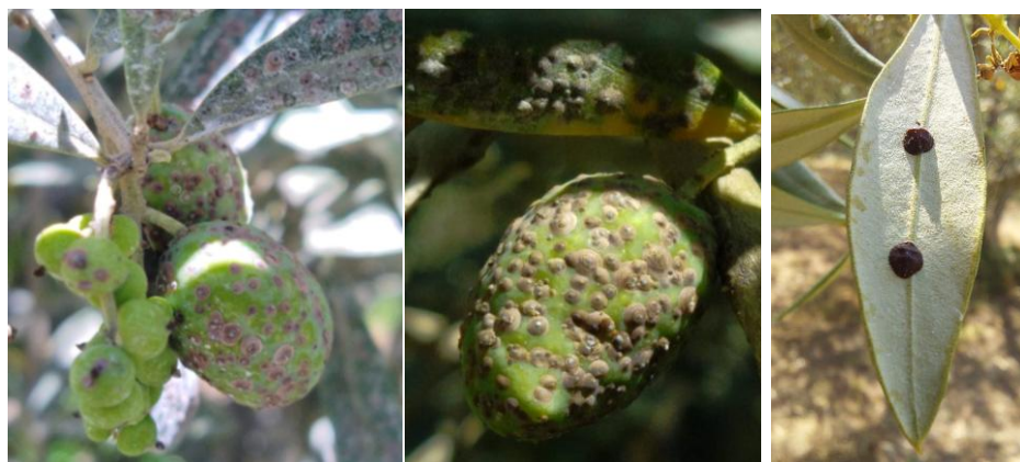
A gauche et au milieu : cochenilles de la famille des Diaspididae A droite : cochenille noire de l'olivier

Les Diaspididae sont caractérisées par la capacité des femelles à construire un bouclier cireux très dur et imperméable les protégeant à leurs différents stades de développement. De plus, la fécondité et le nombre de générations annuelles sont importants, pouvant rapidement créer une forte dynamique de population.