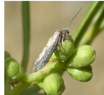
Teigne de l'olivier, papillon adulte

Pour plus d'informations, consultez la page sur la teigne sur le site de France Olive . Vous pouvez également consulter l'article dédié dans le Nouvel Olivier N°127.