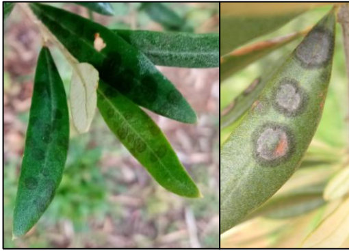
Symptômes d'œil de paon