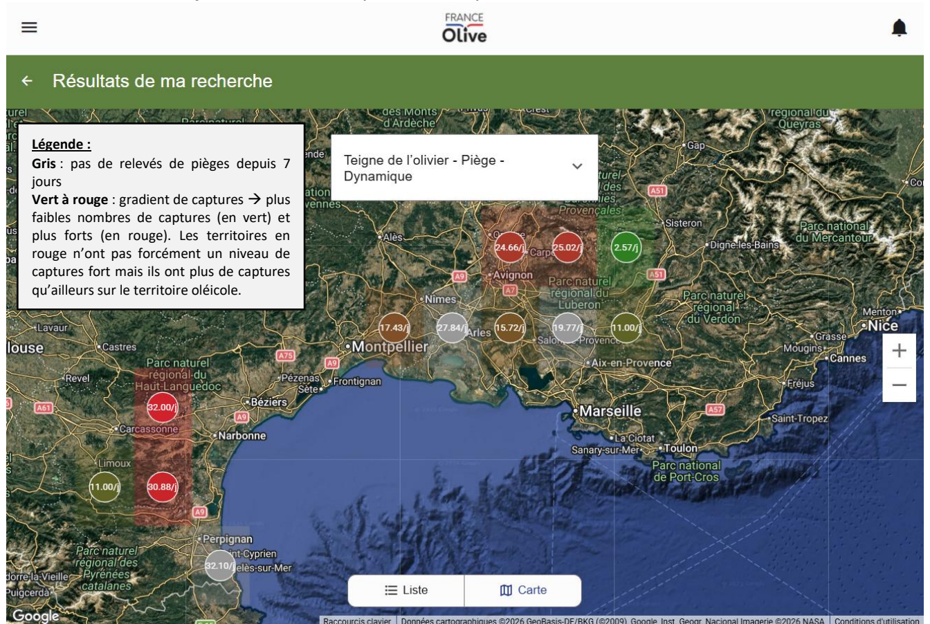
Carte de piégeage de la teigne de l'olivier (moyenne des captures par zones sur les 7 derniers jours)

Le vol des papillons issus de la génération phyllophage est en cours sur une grande partie des secteurs. Les niveaux de captures sont importants des Pyrénées orientales à la basse vallée du Rhône en passant par le sillon audois, la basse vallée de la Durance, les piémonts du Ventoux. Des captures à des niveaux plus faibles ont aussi lieu en haute Provence, dans le Nyonsais, dans les piémonts alpins méridionaux.