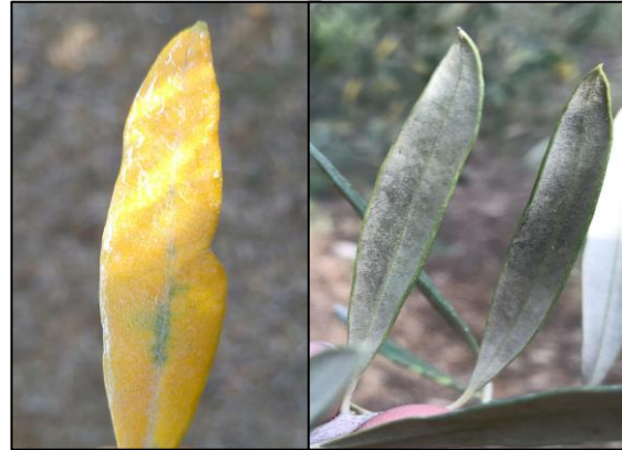
Symptômes de cercosporiose