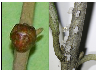
Cochenille noire Stade L3 à gauche Filippia follicularis à droite

Les cochenilles sont des insectes piqueurs-suceurs très polyphages (non spécifiques à une plante hôte) de la super famille des Coccoidea qui regroupe plusieurs familles. La famille des Coccidae (cochenille à carapace) avec notamment la cochenille noire de l'olivier ( Saissetia oleae ) et plus rarement Filippia follicularis est la plus fréquemment rencontrée dans les vergers d'oliviers en France.