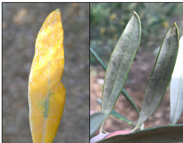
Symptômes de cercosporiose