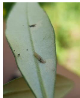
Symptômes et présence de teigne, génération phyllophage, source : Centre technique de l'Olivier

La photo de gauche illustre un symptôme « circulaire » causé par une larve de deuxième ou troisième stade (sortie d'hiver). Sur la photo de droite, la larve sort de sa galerie.