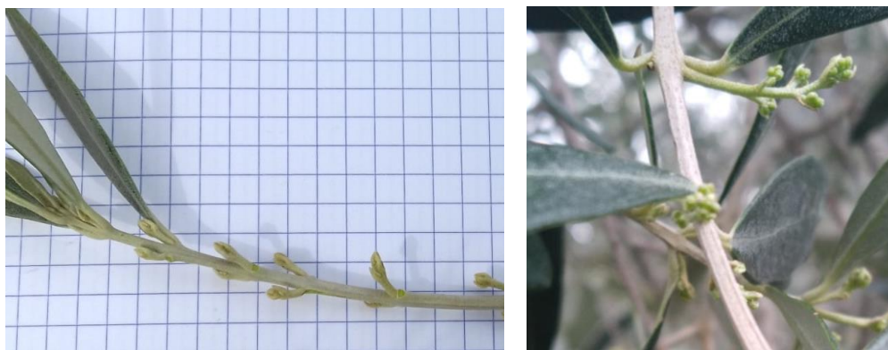
Stade BBCH 52 à 54

BBCH 54 : Les bouquets floraux s'allongent.