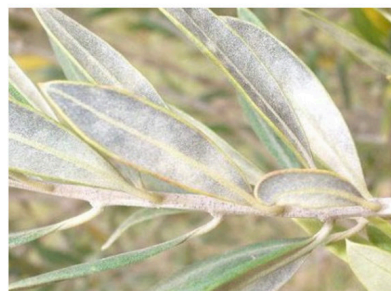
Symptômes d'Œil de paon (à gauche) et de cercosporiose (à droite).

Les observations sont réalisées dans le cadre du suivi biologique du territoire par les techniciens référents sur les départements oléicoles des régions Sud – Provence Alpes Côte d'Azur, Auvergne Rhône-Alpes et Occitanie. Ces observations sont transcrites dans le Bulletin de Santé du Végétal (BSV) ou capitalisées lors de rencontres téléphoniques avant la rédaction de chaque bulletin InfOlive.