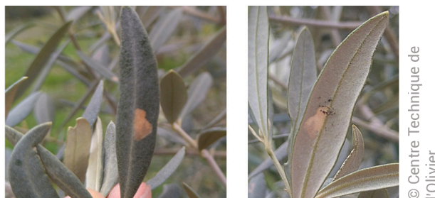
Symptômes de dégâts de teigne (deuxième et troisième stades larvaires) sur feuilles d'olivier.

Si vous utilisez ce produit en mélange il faudra bien vérifier que le pH de la bouillie est inférieur à 9,5.